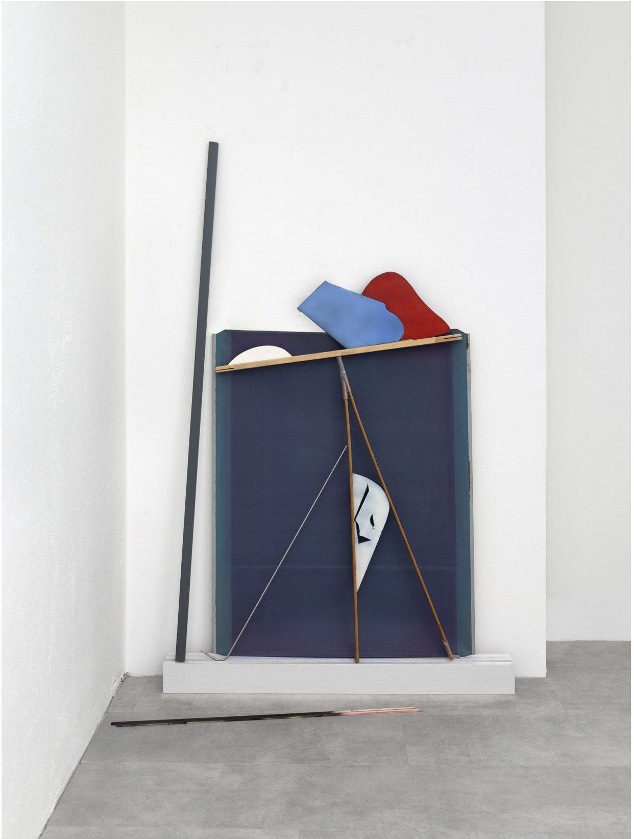
Jessica Buhlmann: Binominal , 2018 | Installation, ca. 168x98x30cm | plastic, wood, acryl, metal