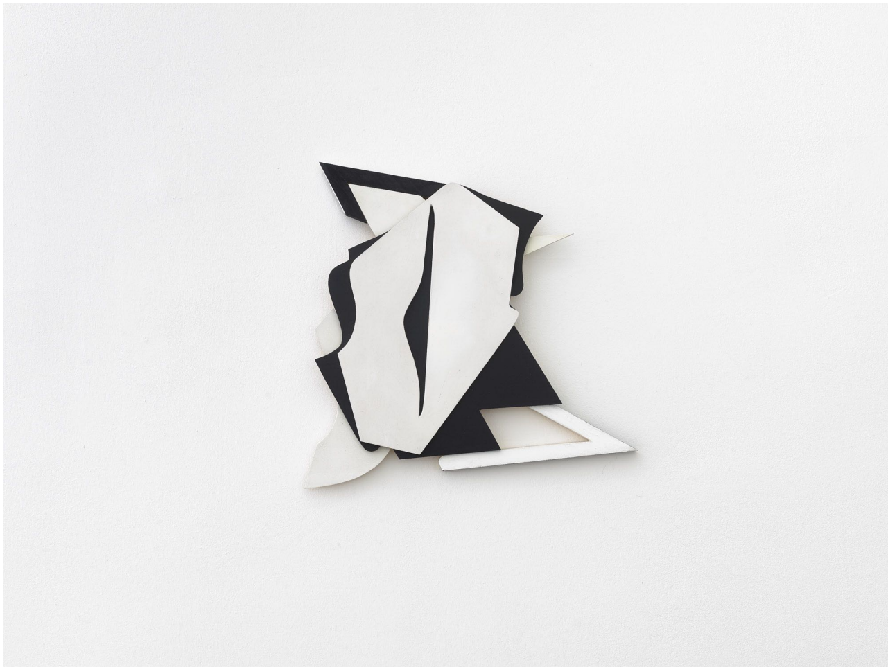
Jessica Buhlmann: Octet , 2018 | Relief | ca. 48x50x3cm | wood, acryl