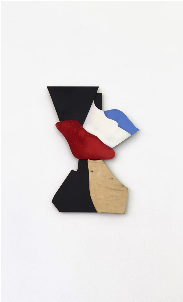
Jessica Buhmann: Les mouvements rotatoires , 2018 | Relief | ca. 62x45x2cm | wood, acrylic