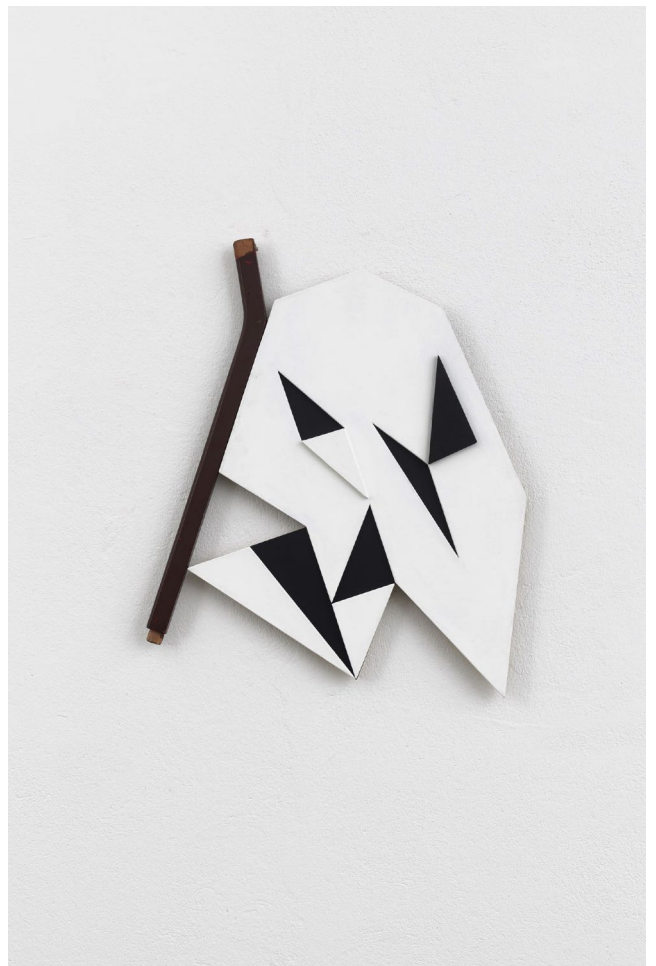
Jessica Buhmann: Awanto , 2018 | Relief ca. 56x47x2cm | CNC-milled wood, wood, acryl