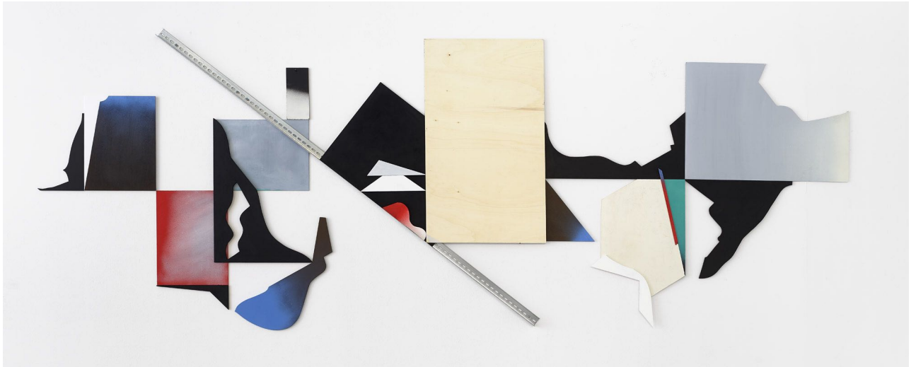
Jessica Buhmann: Stem fields , 2018 | Relief, ca. 125x342x4cm wood, cardboard, acryl, steel