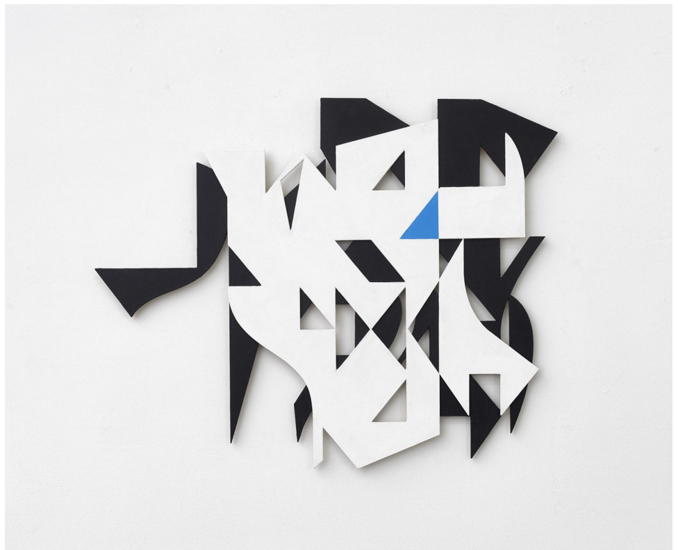
Jessica Buhlmann: Endosymbiosis , 2018 Relief | ca. 95x75.5x2cm CNC-milled wood, acryl