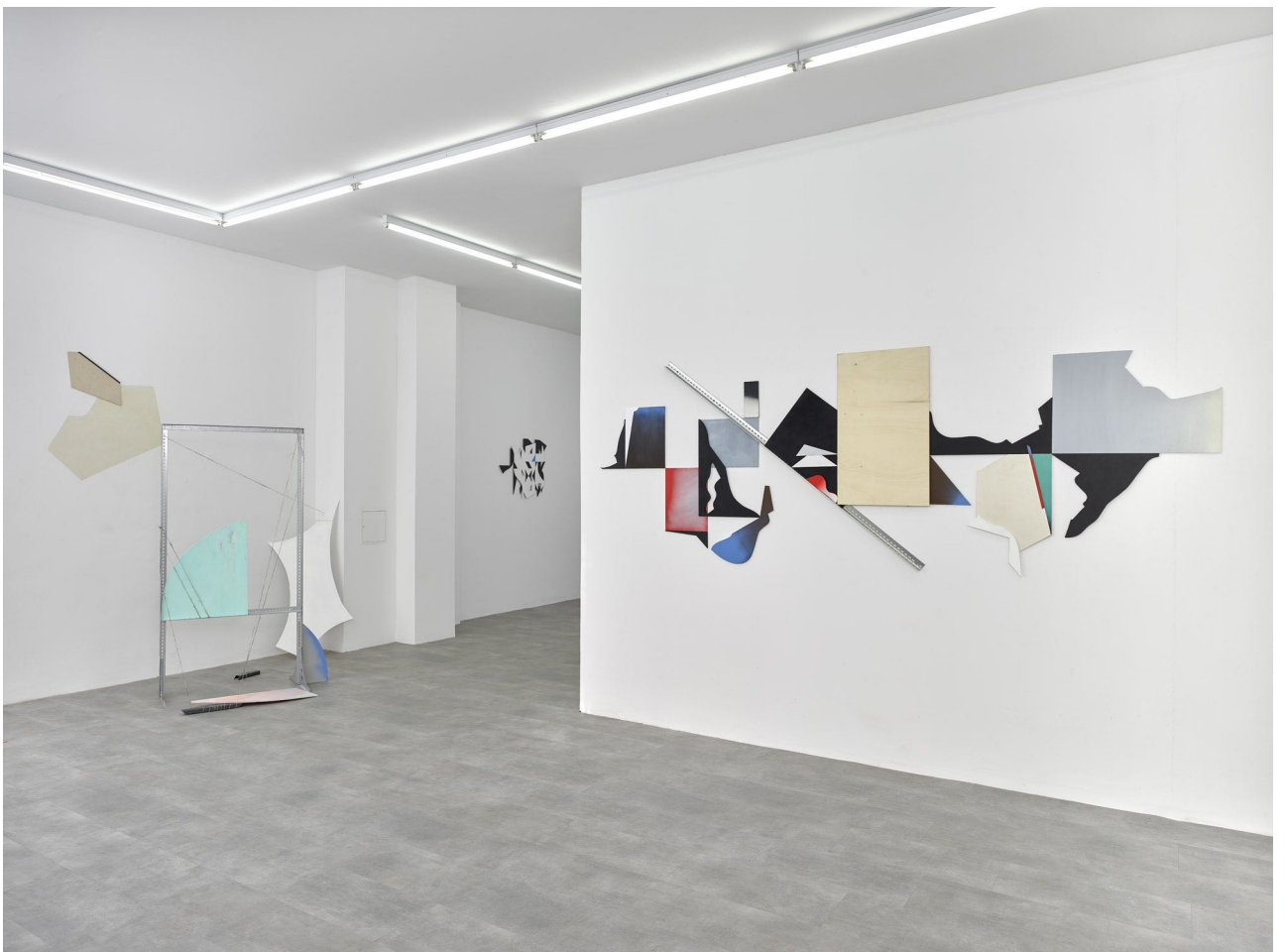
Installation View | Galerie1214 Berlin | Sept. 2018