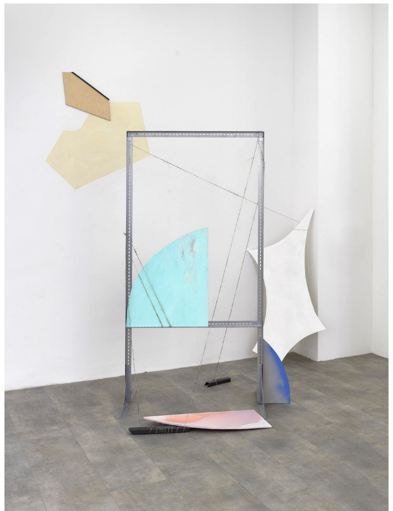
Installation views Galerie1214 Berlin