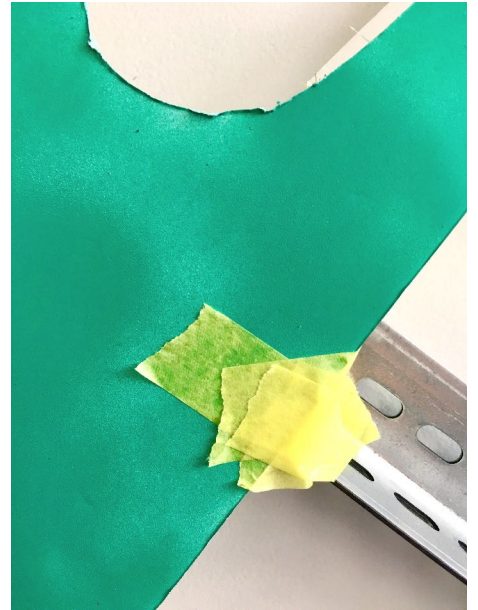
From the artist's studio: drafts and work in progress | courtesy Jessica Buhlmann 2018