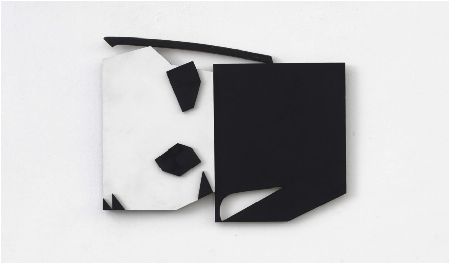
Jessica Buhlmann: Funtunfunefu / Denkyemfunefu , 2018 Relief | ca. 39x50x2cm wood, acryl